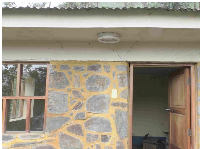
Las paredes exteriores mostraban severas grietas que las hacían ver muy inestables.