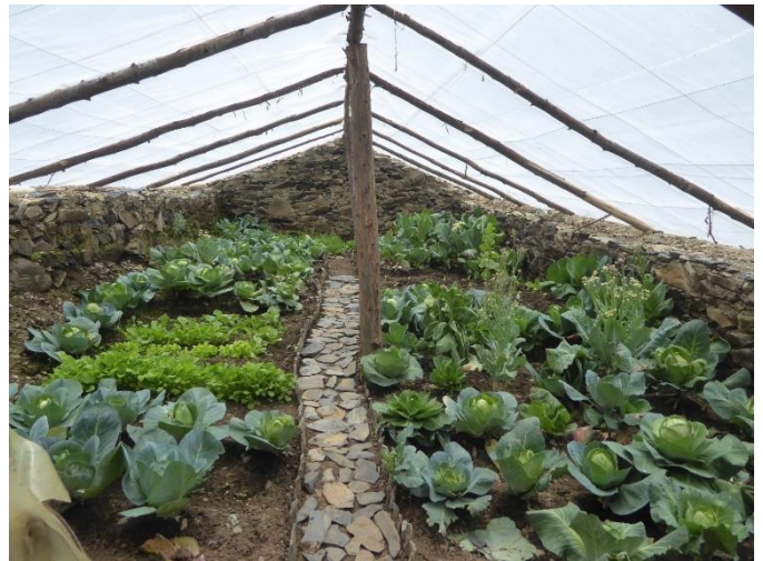
Vista interior del invernadero. Las hortalizas tienen buen crecimiento a pesar de estar por encima de los 4.000 metros de altura.