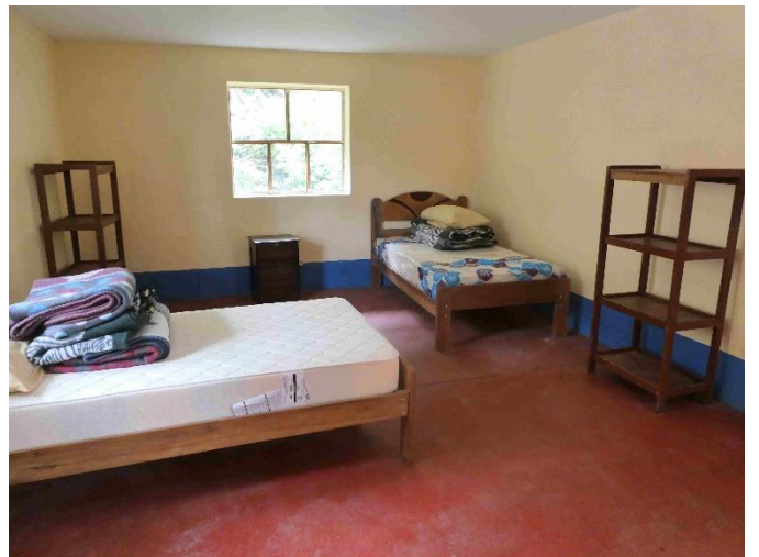
Dos de los cuatro dormitorios con un total de ocho camas.