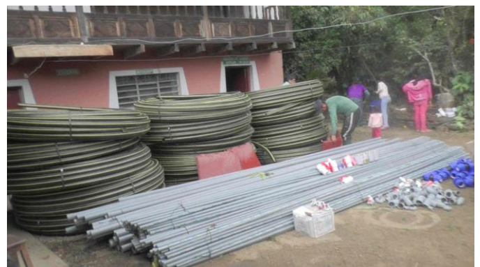
Vista de conjunto de todo el material que compramos para el sistema de riego.