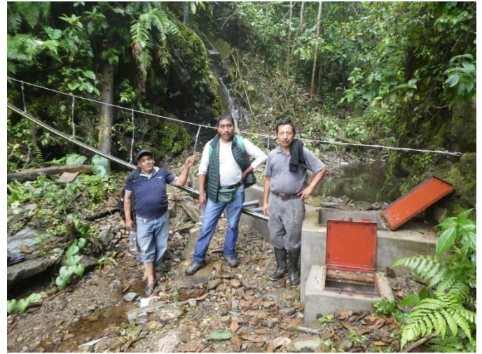
Estanque de derivación. Desde allí, el agua es canalizada unos 3 km por medio de mangueras y tubos hasta llegar a los campos agrícolas.