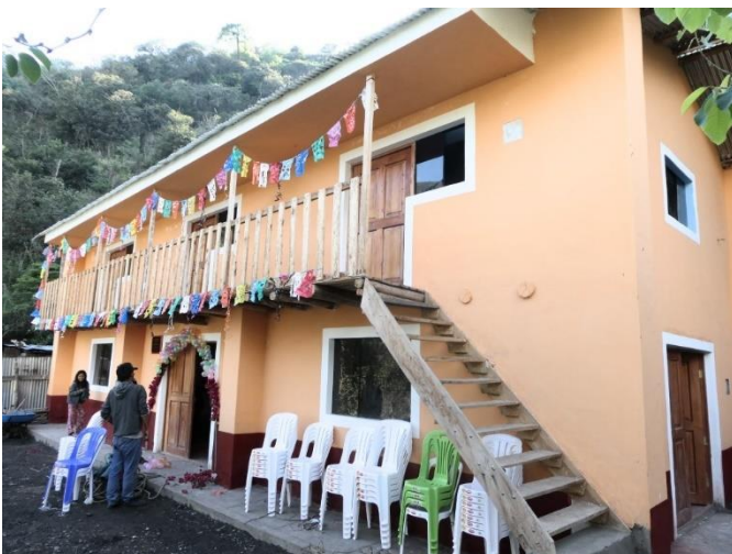
Vista exterior de la casa comunal.

Para mayores informes sobre los antecedentes de este proyecto, vea nuestros últimos informes anuales (2019 y 2020) que se encuentran disponibles en nuestro sitio web bajo "Proyectos".