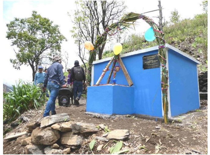
Tanque de almacenamiento principal. Se encuentra en las cercanías de los campos agrícolas y su capacidad es de 9 m 3 de agua.