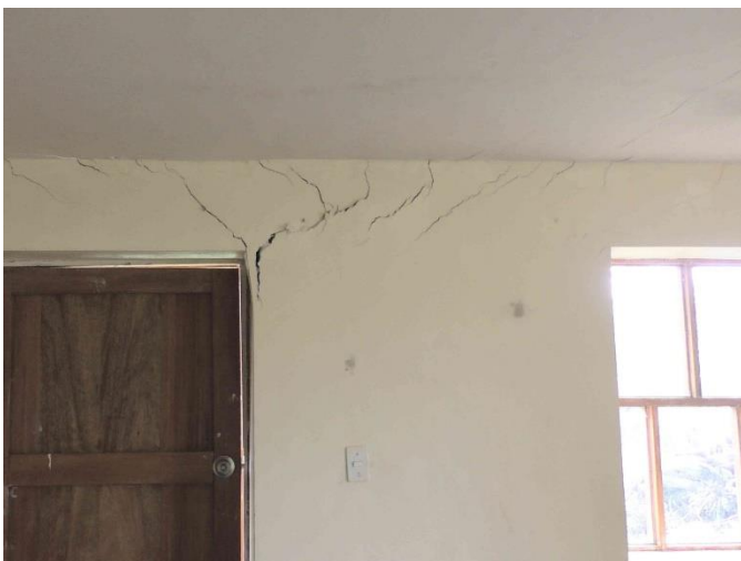
Estado de las paredes interiores antes de la reforma.