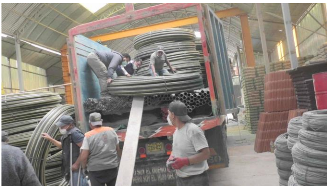
Carga y transporte del material.