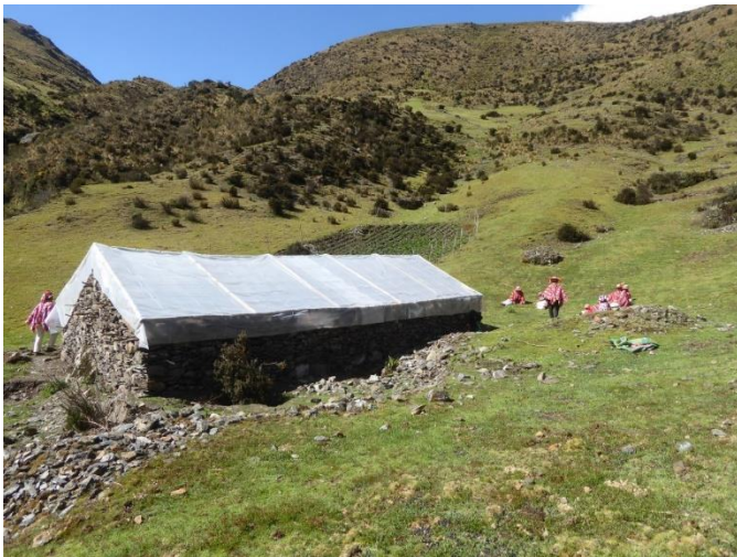
Vista exterior de uno de nuestros invernaderos.

Para realizar el futuro mantenimiento, colaboraremos con la ONG holandesa Por Eso ( www.poreso.org ), que lleva varios años construyendo invernaderos en las regiones andinas de Perú y cuenta con una oficina técnica en el país. En 2021 le hicimos un aporte inicial de US$5.000. Los fondos se utilizarán para cubrir los trabajos de mantenimiento a 20 invernaderos dañados, concretamente para la renovación de la cubierta de polietileno utilizada para el techado.