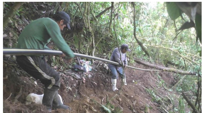
Las mangueras, que cubren una longitud de 3km, se enterraron bajo tierra a una profundidad de 30cm a lo largo de terreno accidentado.