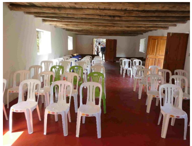
Vista interior del salón.