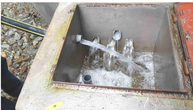
Vista interior del estanque de derivación. Entre la fuente y el tanque de almacenamiento principal construimos cuatro de ellos.