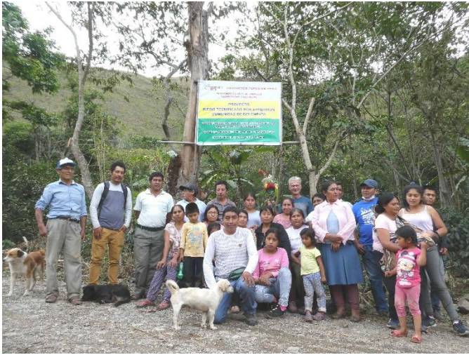
Algunos de nuestros beneficiarios. En el fondo, el cartel con la descripción del proyecto.