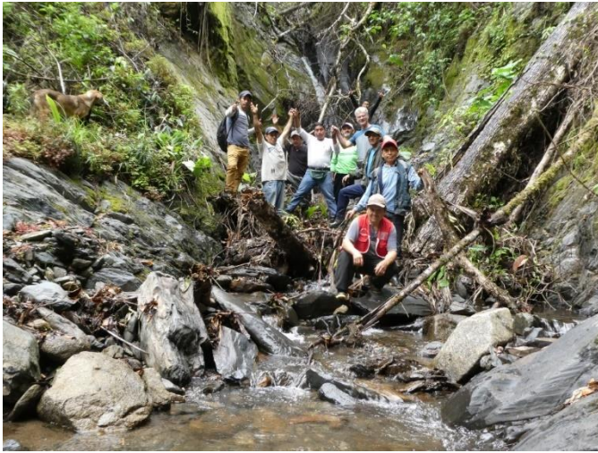
Al fondo, algo oculto, se observa la hendidura por la que brota el agua para el sistema de riego.