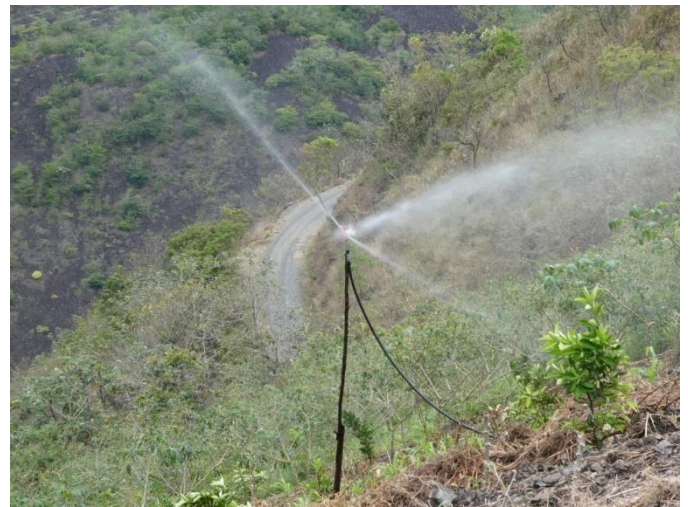
Dos de los 80 aspersores que actualmente riegan 25 terrenos agrícolas.