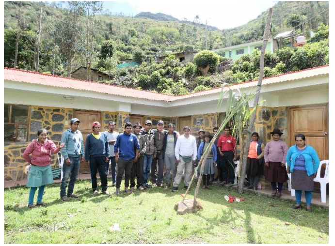
Inauguración junto con algunos pobladores.