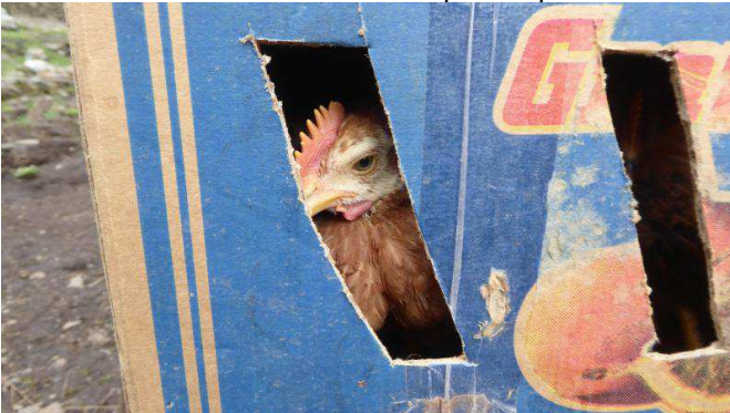
Installation confortable de six poules par caisse.