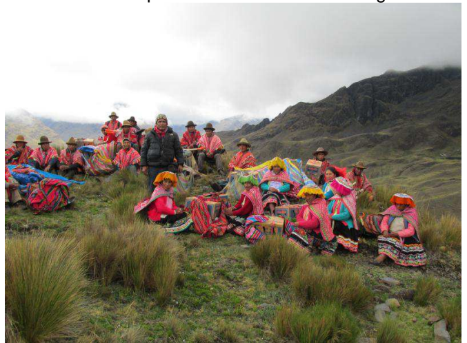
Programmation de plusieurs pauses pour calmer les poules et leur donner à manger.