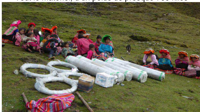
Tout le matériel, d'un poids de presque 700 kilos