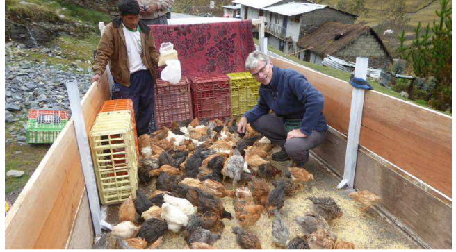
Alimentation des 180 poules avant le début de la longue marche.