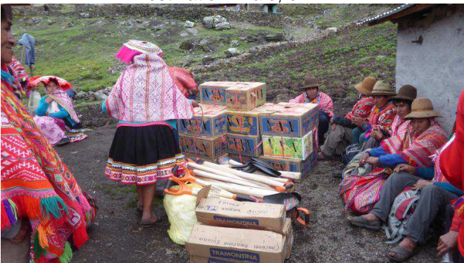
Destination finale, enfin!