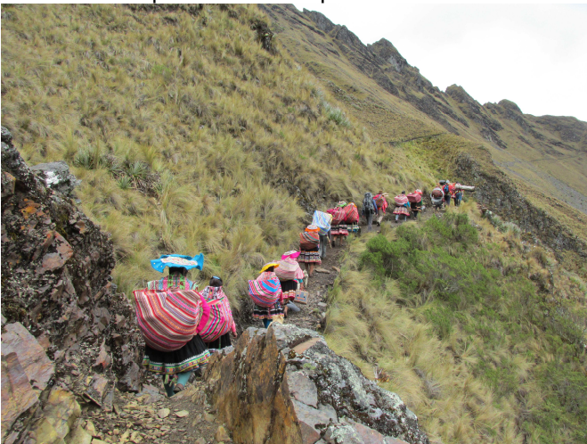
30 personnes ont aidé au transport du matériel pendant les cinq heures de marche.