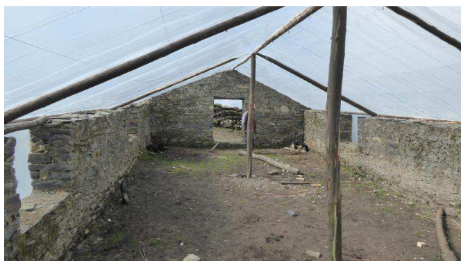
Vu de l'intérieur