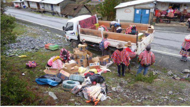
Déchargement du matériel transporté en camion. Préparation de la marche à pied.