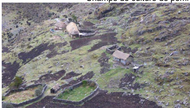
Champs de culture de pommes de terre à 4000 m d'altitude

La petite communauté de Pitukiska est située à 4100 m d'altitude. Sur ces hauteurs des Andes, les habitants peuvent uniquement produire la pomme de terre, les sols ne permettant pas de cultiver d'autres légumes. De plus, les conditions climatiques extrêmes ne sont pas idéales pour cultiver des légumes à ciel ouvert (gèle nocturne, radiation UV diurne, etc.).