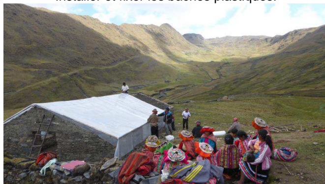
Installer et fixer les bâches plastiques.