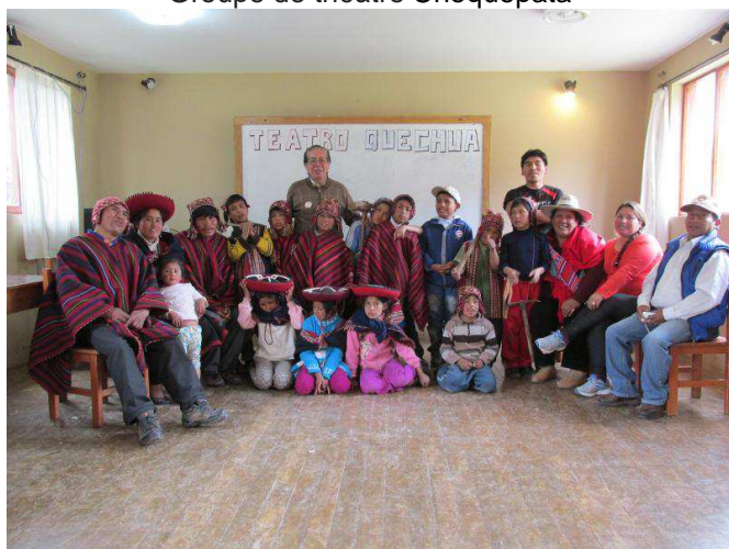
Groupe de théâtre Choquepata