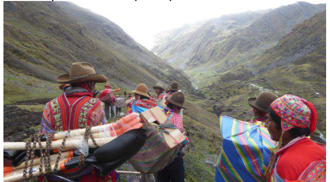
Les pioches et les pèles pesaient énormément !